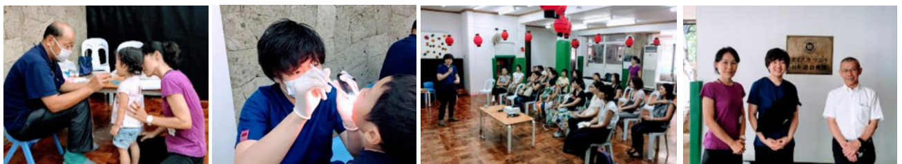
萩野谷先生の保護者懇話会