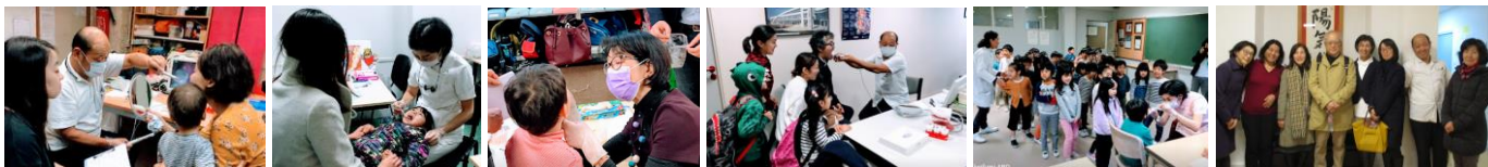
パリ日本人会健康相談会 にご協力下さった方々 (於、天理日仏文化協会)