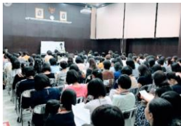
大盛況の子育て講演会