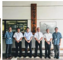
米村校長先生(右から3人目) 大平教頭先生(左から2人目)