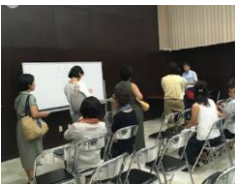
講演後は今年も質問者の列