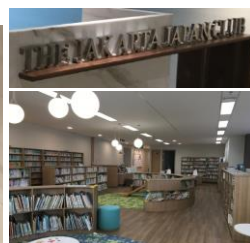
JJC新事務所の図書館(下)