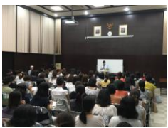
大盛況の子育て講演会