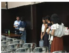
講演後は今年も質問者の列