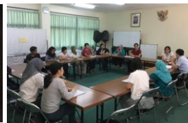
幼稚園職員との懇談会