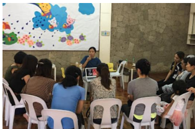
オイスカマニラ日本語幼稚園 片庭 氏撮影