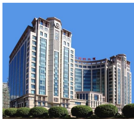
二十一世紀ビル(このビルの1階と2階)