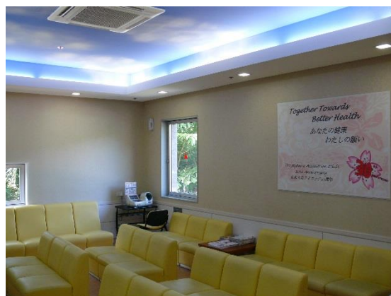
健康診断専用待合室

健診のコースは、日本の特定健康診査に沿った基本的なものから、胃バリウム検査、胃カメラ検査を含むものまで各種ご用意しています。