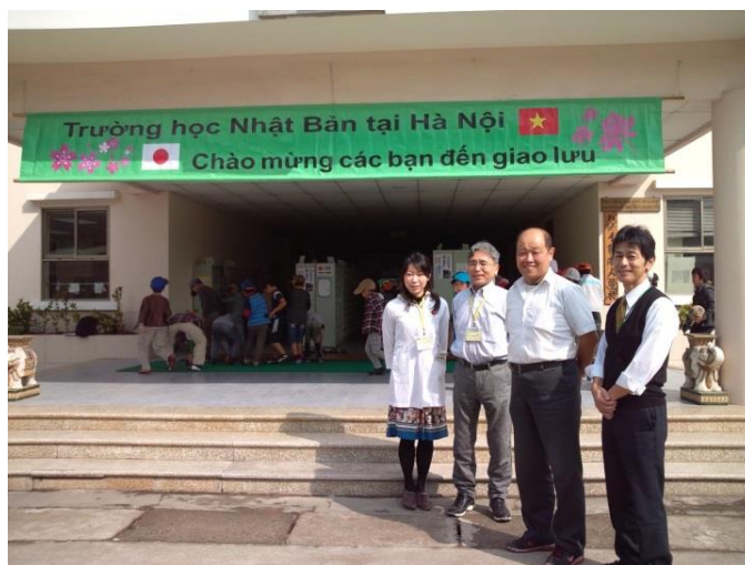
玄関に垂れ幕が 「ハノイ日本人学校、健診ようこそ」

「大人の歯科相談も含め全般的にハノイ在留邦人の歯科健康意識レベルは日本国内に 比較して高い 」と締めくくって頂きました。