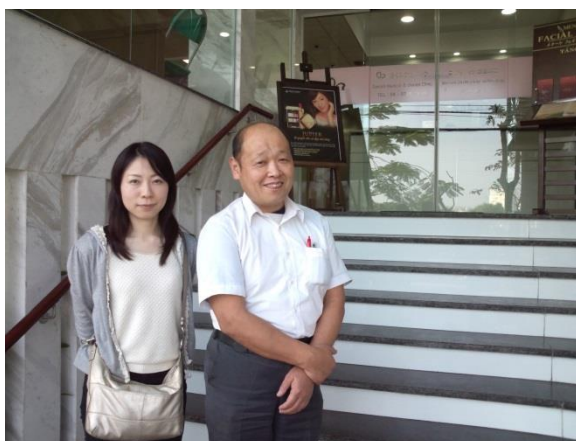
クリニックビル玄関にて

最後に、ベトナム日本商工会・ハノイ日本人学校・ハノイ日本婦人会の関係者の皆様のご尽力に感謝申し上げます。