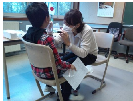
片山先生：上あごの奥までしっかり診ます