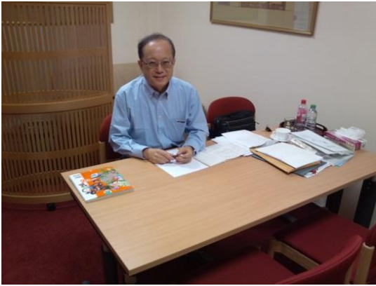
NHK「すくすく子育て」でお馴染み榊原洋一先生